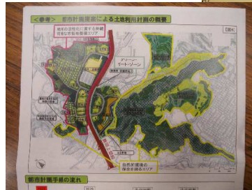
←開発計画案図

計画マスタープランや国の国土利用計画に反する、谷戸の埋立造成は液状化など災害リスクが高い、みどり税は緑を守るためのもの、古代の製鉄遺跡は壊されてしまうなどでした。6人のうち、2人は若者でした。