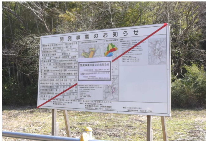
開発事業廃止のお知らせの立て看板

3月1日、「栄区上郷猿田地区における開発は事業者が断念されました」と各メディアは報じました。粘り強く開発の不当性を告発し、署名を集め、議会陳情、都計審傍聴と頑張りぬいた住民運動の勝利です。